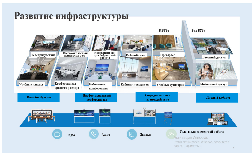
Рисунок 3 – Развитие инфраструктуры

Изменение инфраструктуры учреждения характеризуется достижением следующих целей: автоматизация функций Центра информационно-технического обеспечения и цифровизации; обеспечение большего качественного охвата аппаратных средств контролем, не увеличивая при этом количество инженеров, необходимых для проведения администрирования и моторинга работы системы; обеспечение интероперабельности, осуществление автоматизированного сбора актуальной и полной информации об объекте проверки, применение омниканального подхода (беспроводные и непрерывные коммуникации) (рисунок 3).