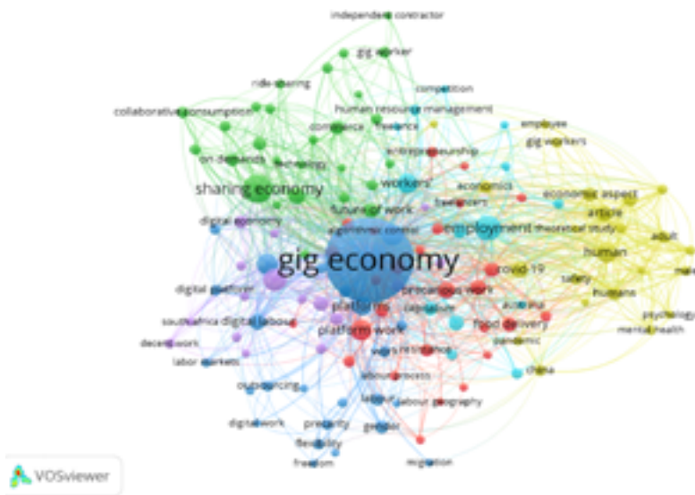
Сурет 2. Scopus библиографиялық дереккөзіндегі gig-экономикаға қатысты зерттеулердегі кілт сөздерді сәйкестендіру желісі.

Gig-экономика жағдайында қалыптасатын ерекшеліктерді ескере отырып, VOSviewer бағдарламалық жасақтамасында қосымша талдау жасағанда келесідей нәтиже шығады (сурет 2).