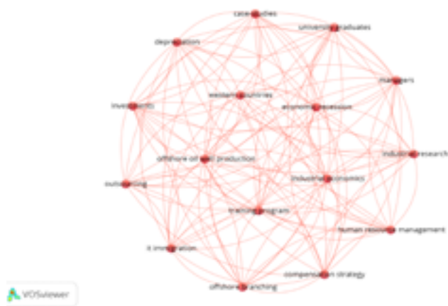
Сурет 4. Scopus библиографиялық дерекқорындағы таланттарды басқаруға және gig-экономикаға қатысты индекстелетін кілт сөздер (Figure 4. Indexable keywords related to talent management and Gig economy in the Scopus bibliographic database)

Бұл жерде индекстелетін кілт сөздер де ескерілді. Индекстелетін кілт сөздерді негізінен Scopus өзі тандайды және олар Elsevier иелік ететін немесе лицензиялайтын тезаурустардан алынған сөздіктер үшін стандартталған. Индекстелетін кілт сөздердің автордың кілт сөздерінен айырмашылығы, индекстелген кілт сөздер синонимдерді, әртүрлі емлелерді және көпше сөздерді ескереді (сурет 4).